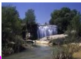
POZ N DE VERO